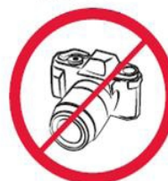
Profesjonalne aparaty fotograficzne, kamery wideo