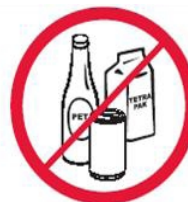
Butelki, puszki, kubki, dzbanki