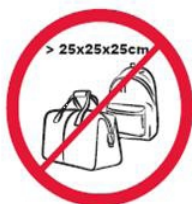
Pudła, torby, plecaki, walizki i inne wszelkie przedmioty większe niż 25 cm x 25 cm x 25 cm