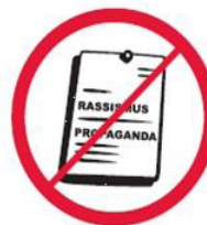
Materiały rasistowskie, ksenofobiczne, polityczne, religijne, propagandowe