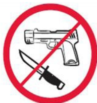
Broń, materiały wybuchowe, noże

Piktogramy odnoszące się do regulacji porządkowych wynikających z regulaminu, które oznaczają zakaz wnoszenia, posiadania i używania niżej oznaczonych przedmiotów na stadionie