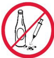
Napoje alkoholowe, narkotyki