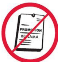
Przedmioty, materiały, ubrania komercyjne i promocyjne