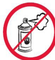
Gaz w aerozolu, substancje żrące, łatwopalne, barwniki