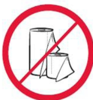
Duże ilości papieru