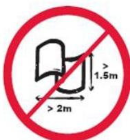
Banery lub flagi o wymiarach większych niż 2.0 m x 1.5 m.