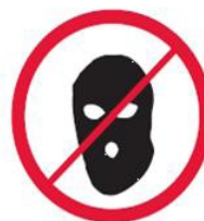
Części ubioru zakrywające twarz, kominiarki