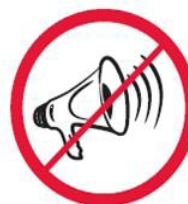
Megafony, syreny, inne urządzenia emitujące dźwięk