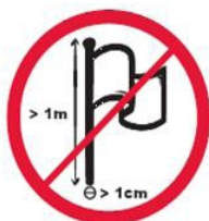
Maszyny flagowe lub banerowe o większej długości niż 1 m, i średnicy niż 1 cm